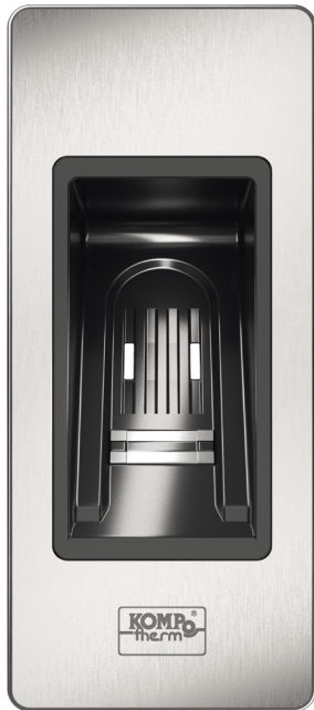
KOMPO-Safe-Qscan Paket Artikel Nr. 14270