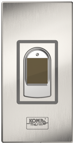
KOMPO-Safe-Touchscan Paket Artikel Nr. 14570